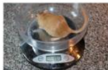
Det ska också vara en bild som visar djurets vikt

Till petklass behövs även en liten film som visar att det går att hantera djuret. Det är också bra om man drar fingret eller blåser mothårs i pälsen så att huden och pälsens spänst syns, samt grundfärgen i standardklass, foto eller film.